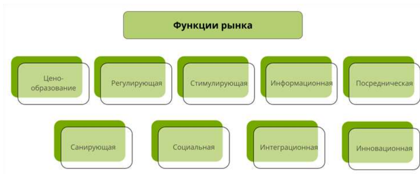
Рис. 1. Функции рынка

Рынок обеспечивает установление равновесной цены , при которой участники готовы заключать сделки. Рынок немедленно реагирует на любые изменения и подстраивает цену под них.