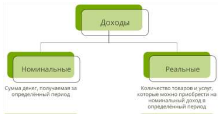
Рис. 2. Виды доходов

при инфляции в 7 % и доходности вклада в 10 % Николай получает рост реальных доходов в 3 %. Так как действие инфляции имеет отрицательный эффект, доход от вклада — положительный.